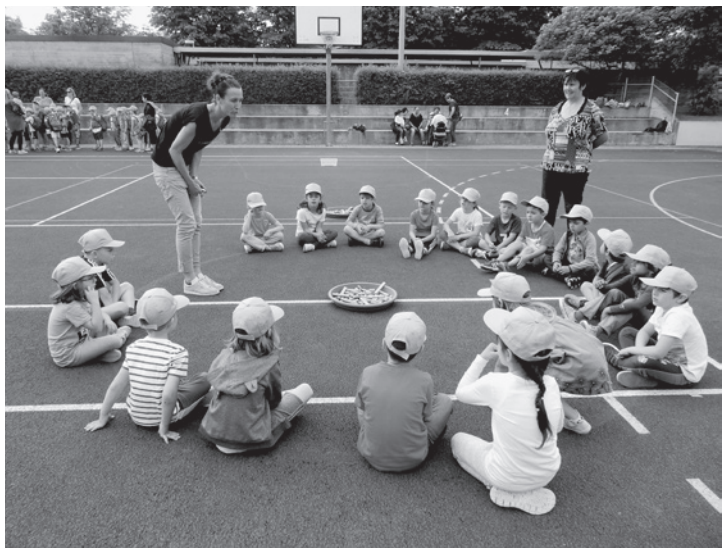
Die Zahl der Kindergärtler wird in den nächsten Jahren deutlich ansteigen. (Bild vom Kindergarten-Sporttag 2018)

Wie erwartet folgten in der Zwischenzeit zwei weitere starke Geburtenjahrgänge und entsprechend der Demografie dürfte sich in den nächsten Jahren hieran nichts ändern. Wir rechnen deshalb mit einer zwölften Kindergartenabteilung im Sommer 2020 und je einer zusätzlichen Abteilung in der Unter- und der Mittelstufe im Verlauf der nächsten vier Jahre. Nach aktueller Einschätzung dürfte die Spitze bei den Schülerjahrgängen 2029 erreicht werden – vorausgesetzt, die Geburtenrate sinke nicht wieder deutlich ab.