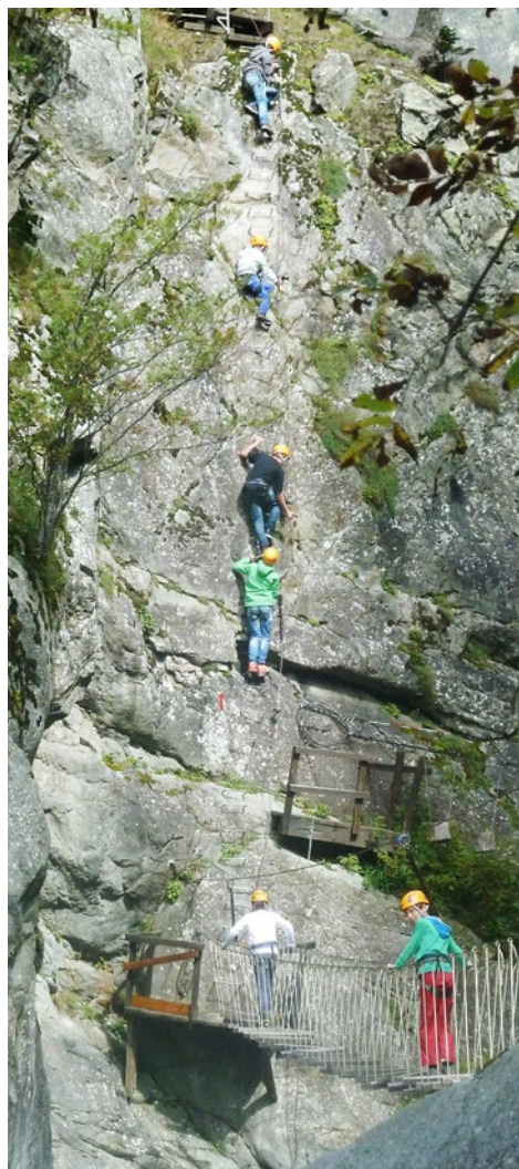
Lager 5. Klasse Ruoff: Im Klettersteig

18. bis 22. August Klassenlager 6. Klasse Köhler in Gersau SZ