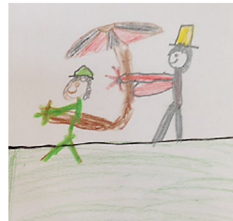
Einander Sorge tragen – füreinander schauen

In den letzten 65 Jahren, seit der Erstellung des Kindergartens Sonnenwinkel, hat sich vieles auch in der Kindergartenpädagogik verändert, was eine Anpassung der in die Jahre gekommenen Kindergartenräume verlangt. Auch hier sind alle Beteiligten wieder gefordert bezüglich der relativ knappen Umbauzeit, welche 2 bis 3 Wochen vor den Sommerferien 2015 und durch diese hindurch dauern wird.