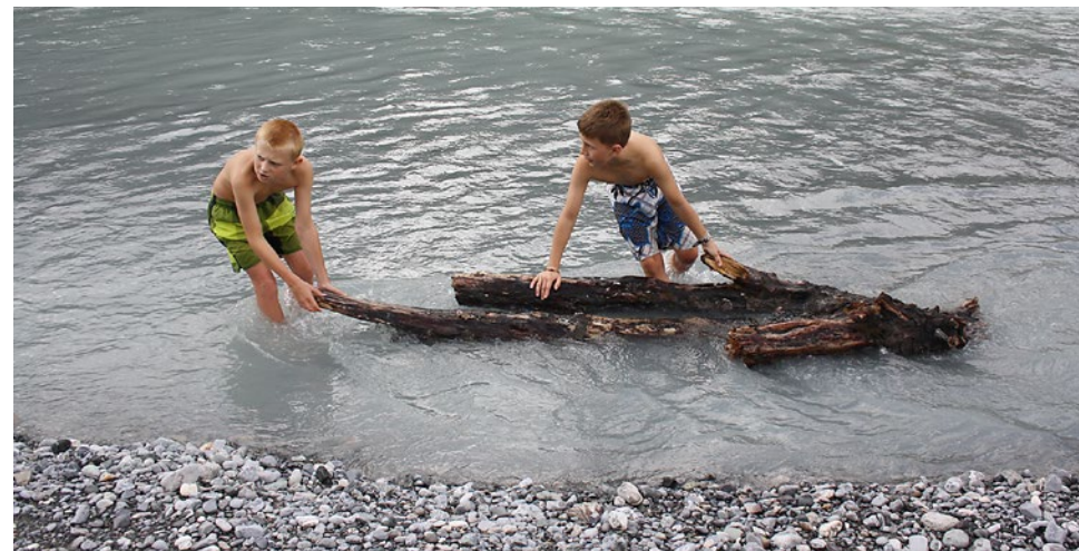
Sommerferienlager: Abkühlung und Abenteuer im Inn