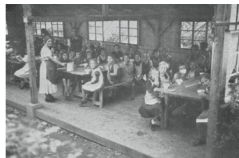
In der Esshalle

Die Situation der Schulgemeinde Romanshorn verschärfte sich, nachdem die Schulgemeinde Wein-