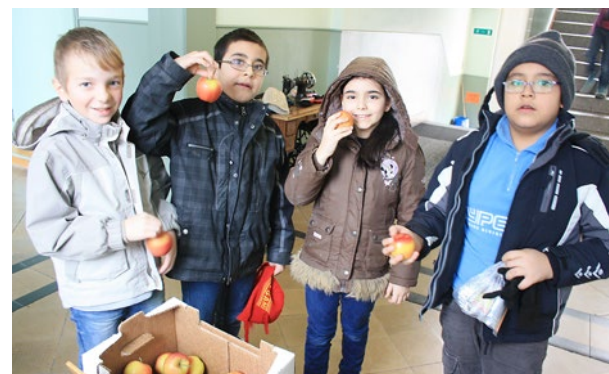
Gesunder Znüni während der Apfelwoche