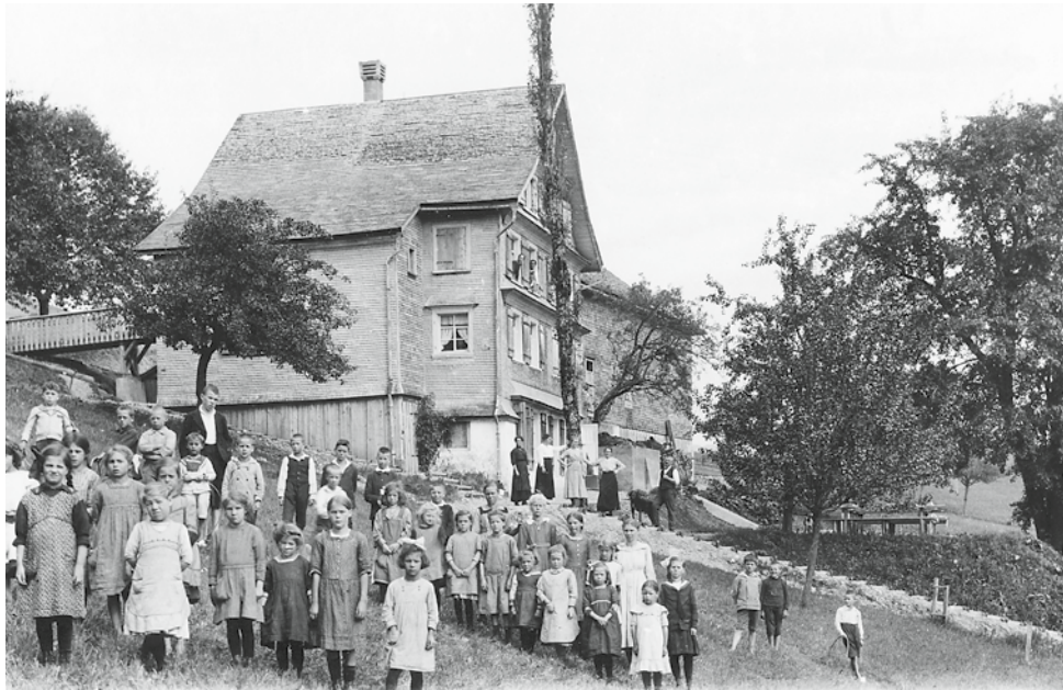
Der «Sonnenberg» von Westen. Das Foto stammt aus der ersten Hälfte der 20er-Jahre vor dem Bau der Esshalle.

1923 lag die Belegung wieder unter 5'000 Kurtage (4'914 Kurtage). Die Rechnung schloss wegen teurer Milch und teurem Fleisch schlechter ab, aber im Winter 1923/24 wurde der «Sonnenberg» erstmals auch im Winter offen gehalten, und es waren die ganze Zeit acht bis zehn Kinder dort in Kur, was die Rechnung wieder um 900 Franken aufbesserte.