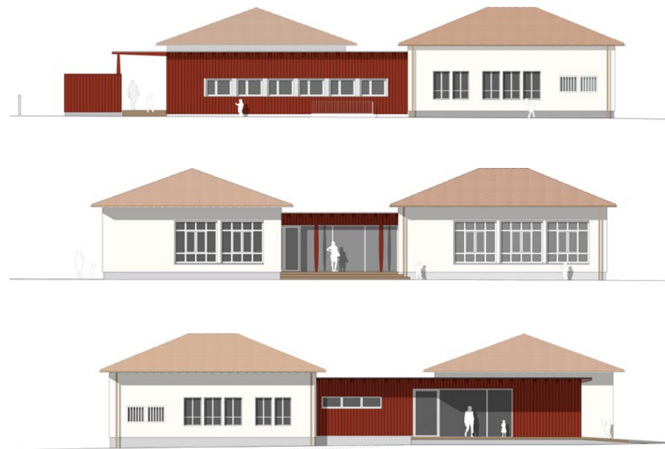
Der Kindergarten Sonnenwinkel wird im Sommer 2015 renoviert. Die Projektbilder zeigen die Ansicht von der Salsmacherstrasse (oben), vom Hochhaus im Westen (Mitte) und vom benachbarten Restaurant Friedberg (unten) – auf dessen Seite der Eingang zum Kindergarten neu zu liegen kommt.