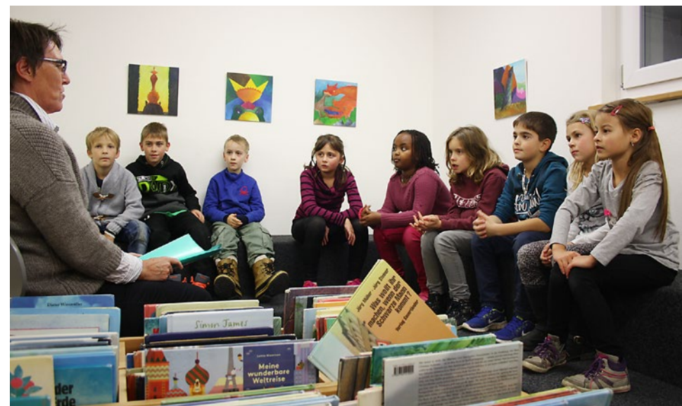
Während der Lesenacht machten die Klassen vom Pavillon auch Station in der Gemeindebibliothek – und hörten dort spannende Geschichten

Im Advent Diverse weitere Auftritte und andere Adventsaktivitäten einzelner Klassen und ganzer Schulhäuser