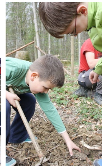
Baumpflanzaktion: Das wird einmal ein grosser Baum!