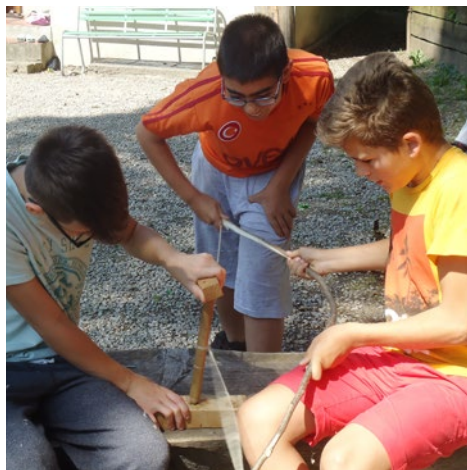
Lager 6. Klasse Ihle: Feuermachen wie «anno dazumal»