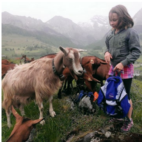
Lager 3. Klasse Bürgi: Was hat es wohl Gutes im Rucksack?

7. und 8. August Ortskonferenz: Planungs- und Arbeitstage für alle Lehrpersonen