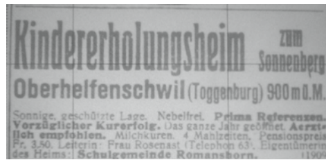
Inserat in der NZZ in den 1930er-Jahren

machungen behauptete, Kinder vom «Sonnenberg» hätten zum Spielen eine Wiese benutzt, die eigentlich den Kolonien des im Dorf gelegenen «Sonnenhofs» gehörten. Oder Scherereien mit privaten Zimmervermietern, bei denen Koloniekinder ohne Aufsicht und deshalb etwas wild übernachteten usw. Immerhin, von Unfällen blieb der «Sonnenberg» weitgehend verschont. Die Jahresberichte melden bis 1940 nur drei schwerere Vorfälle. Im Jahresbericht 1926 ist von einem Knaben die Rede, der einen Gegenstand verschluckt hatte und operiert werden musste. Das Objekt ging schliesslich, ohne einen weiteren Schaden zu hinterlassen, auf natürlichem Wege ab. 1928 erkrankten zwei Kinder ernstlich. Eines konnte nach einem Spitalaufenthalt geheilt entlassen werden. Ein Knabe starb wenige Stunden nach der Überführung ins Spital Wattwil an einer Hirnhautentzündung, die er sich aber nach dem Urteil der Ärzte schon vor dem Eintritt in die Kolonie zugezogen hatte.